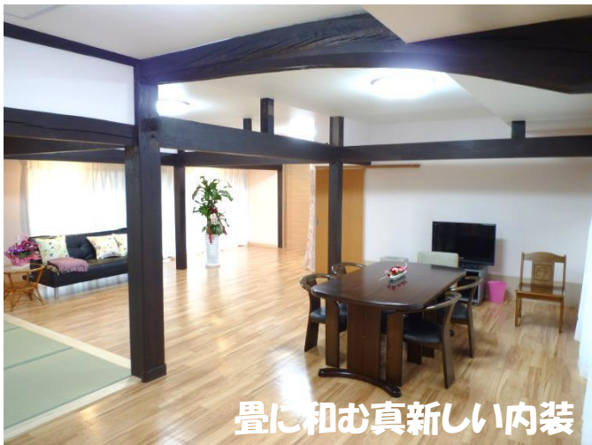
畳に和む真新しい内装