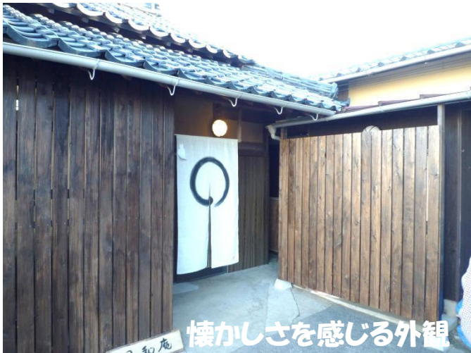
懐かしさを感じる外観